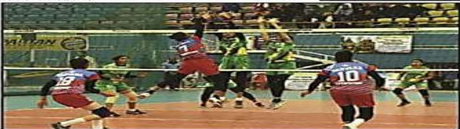
গুৱাহাটীত চলি থকা ছিনিয়ৰ ৰাষ্ট্ৰীয় ভলীবল প্ৰতিযোগিতাত সোমবাৰে এখন খেলৰ দৃশ্য

আমাৰ অসমৰ মহানন্দাৰ বাৰী, ৬ ফেব্ৰুৱাৰী : ছিনিয়ৰ ৰাষ্ট্ৰীয় ভলীবল প্ৰতিযোগিতাত আমোজকৰণৰ বাবে অসমৰ পুৰুষ দলৰ লগতে মহিলা ভলীবল দলটোৱেও গ্ৰুপ পৰ্যায়ত পৰাই বিদায় ল'বলগীয়া হয়। গুৱাহাটীৰ সৰসজী ট্ৰেডিং প্ৰকল্পৰ কৰ্মচাৰী নৰীম চক্ৰ বন্দলৈ ইনভ'ল্ভ প্ৰেডিয়াসত চলি থকা প্ৰতিযোগিতাত অসমৰ মহিলা ভলীবল দলটোৱে নিজৰ অন্তিম গ্ৰুপ মেচত তেলেগানাৰ হাতত পৰাজ হয় ৩-০ বাৰফালত। অসমৰ পুৰুষ দলেও গ্ৰুপ পৰ্যায়তে নিজৰ অভিযান সামৰিছিল। উত্তৰাখণ্ডৰ য়ে পূৰ্বে ছিনিয়ৰ ৰাষ্ট্ৰীয় প্ৰতিযোগিতাৰ কাৰ্যসূচী অসমৰ পুৰুষ দলে এয়াৰ গ্ৰুপৰ পাঁচখন মেচৰ চাবিন্ফতে পৰাজ হয়। গ্ৰুপ ত্ৰি'থ অস্তিম খেলোৱাত অসম ৩-১ৰ বাৰফালত পৰাজ হয় তেলেগানাৰ হাতত। প্ৰতিযোগিতাৰ প্ৰথম দিনা অসমে নিজৰ প্ৰথম মেচখনত কাৰাচ হেছিল নিজেগোৱাৰ বিৰুদ্ধে। বাৰফাল ৩-১। অবশ্যে দ্বিতীয় মেচত উত্তৰ অৰুশেশ বিৰুদ্ধে ৩-০ৰ বাৰফালত জয়লাভ কৰি অসমে প্ৰত্যাবৰ্তন কৰিছিল। কিন্তু উৰুখণ্ডই ৩-১ৰ আৰু কাৰাচই ৩-০ৰ বাৰফালত পৰাজ কৰাৰ পাছত অসমৰ অগ্ৰগতি তুক হৈ পৰে।