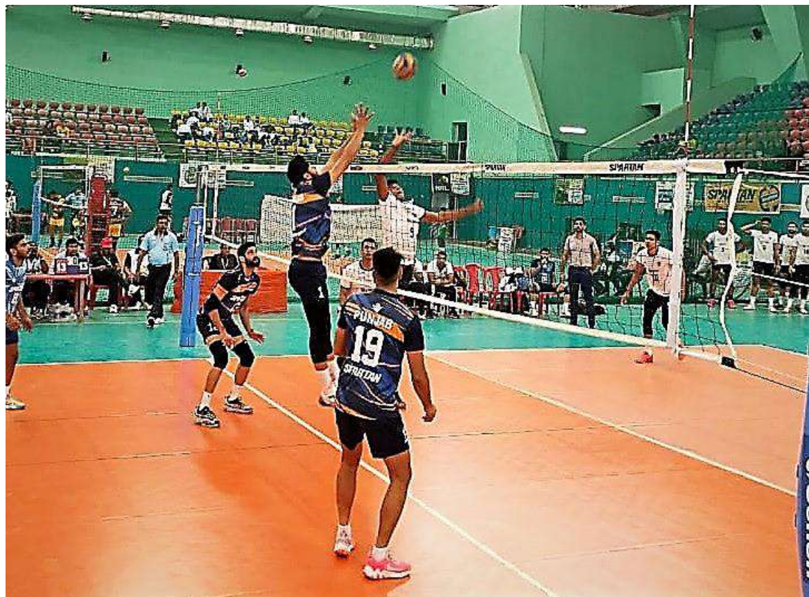
An action moment of match between Punjab and Services Men teams