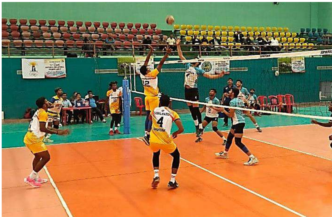
A moment of action during the match between Tamil Nadu and Jharkhand Men teams