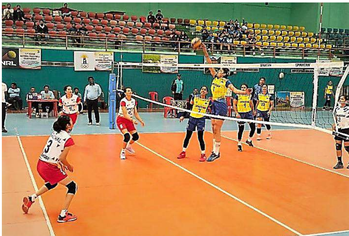
An action moment of match between Rajasthan and Himachal Pradesh Women teams